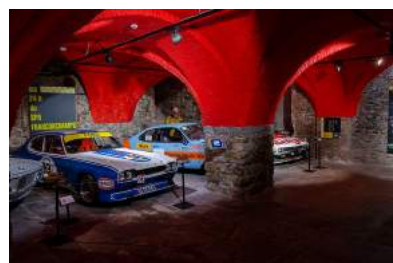
Musée du circuit