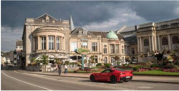
Casino de Spa

18h30 : Tinquieux. Soirée étape Novotel Tinquieux 3*