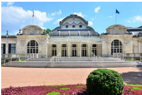
Grand Casino de Vichy

Vichy : Coucher Hôtel Ibis Centre 3* (Centre ville)