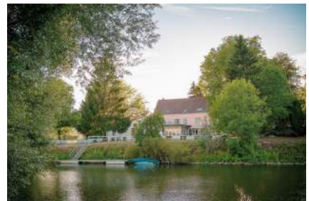
Auberge du Port 3*