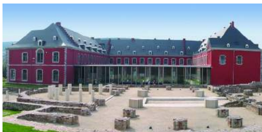
Abbaye de Stavelot