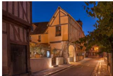
Hôtel Aux Vieux Remparts 3*