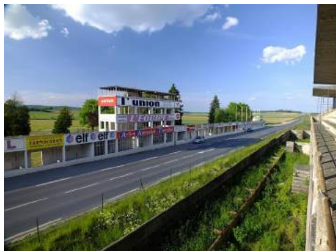
Circuit de Reims-Gueux

19h00 : Saint Père sur Loire Soirée étape Logis hôtel du Château 3*