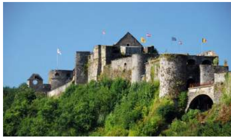
Château de Bouillon