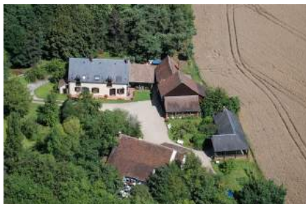
Musée vivant de l'Apiculture