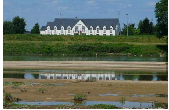
Logis Hôtel Sully le Château St Père/Loire 3*