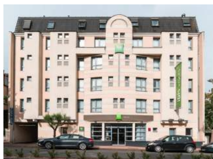
Hôtel Ibis Centre 3*