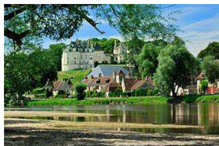
Appremont sur Allier

19h00 : Provins Soirée étape Hôtel Aux Vieux Remparts 3*