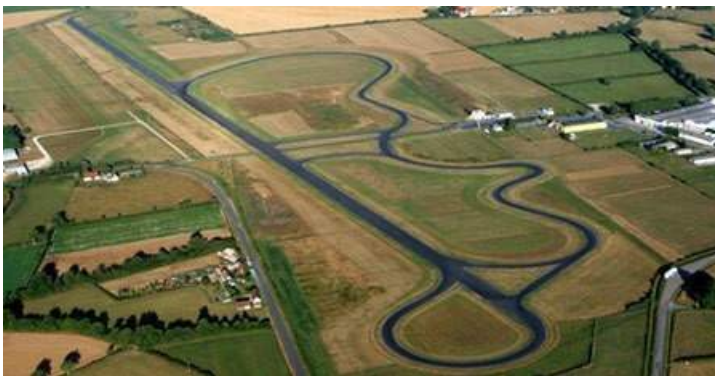
Circuit de Lurcy Lévis

20h00 : Dîner de gala de la ville de Vichy