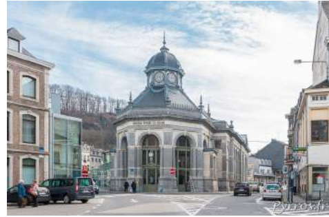
Pouhon Pierre le Grand (source)