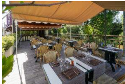
Hôtel-restaurant Saint Hubert