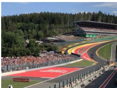
Circuit de Spa-Francorchamps