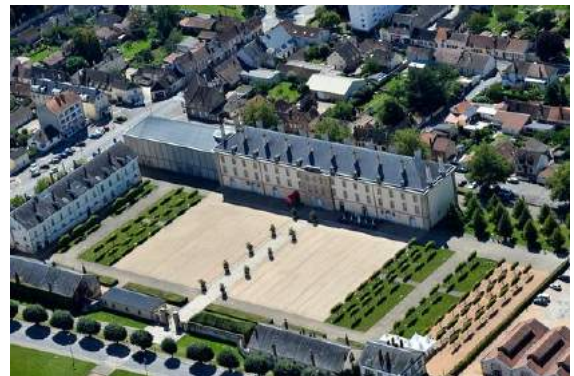
Centre National du Costume de scène