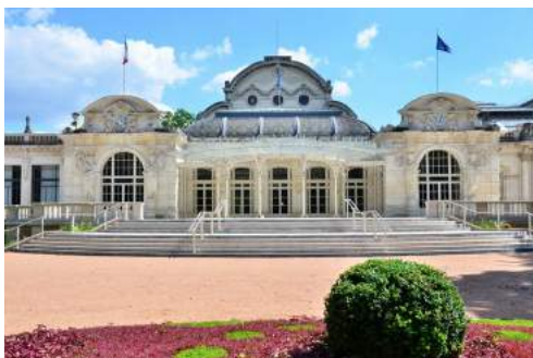
Grand Casino de Vichy