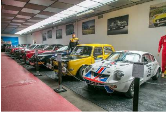
Auto Sport Museum