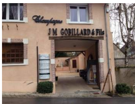
Cave dégustation Champagne Gobillard